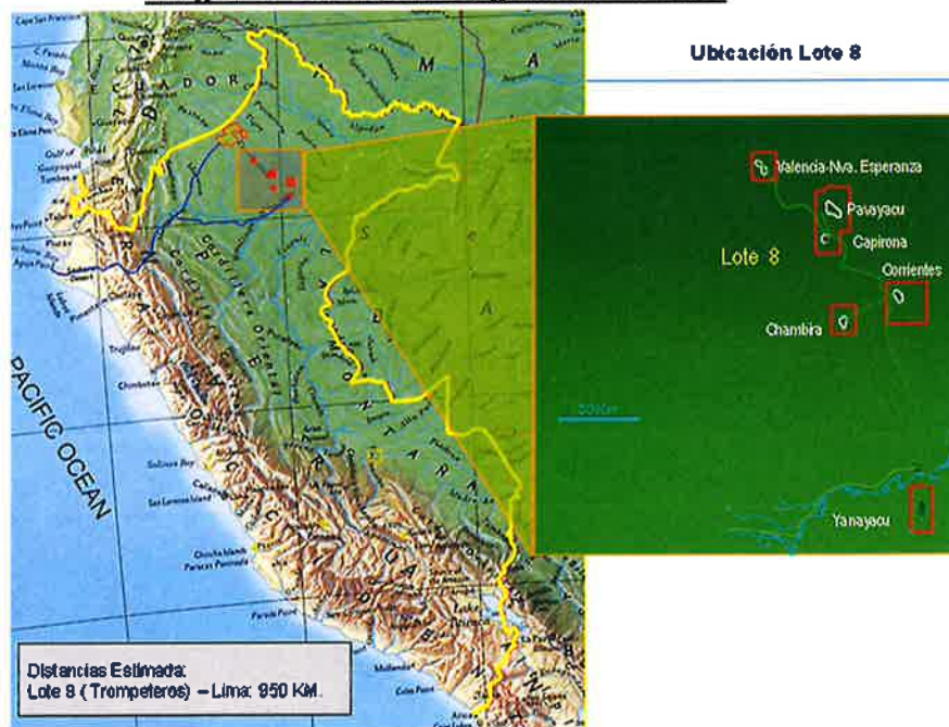
Imagen 1: Ubicación Geográfica del Lote 8

El SERVICIO se realizará en las instalaciones de los yacimientos de Corrientes y Pavayacu que se encuentran en el Lote 8 en los distritos de Trompeteros y Urarinas, provincia de Loreto, región Loreto – Perú.